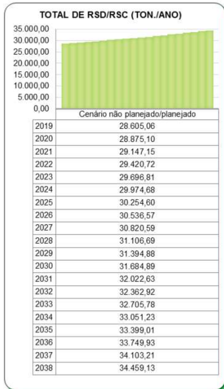
Figura 2: Projeção Geração Total por Ano

Considerando que o CADRI que a SAEG tem autorizado com a CETESB é de 30.330 ton/ano e que a projeção para o ano de 2022 definida no PMGIRS é de 29.420,72, será adotado, para esta licitação, o valor de 30.330 ton/ano.